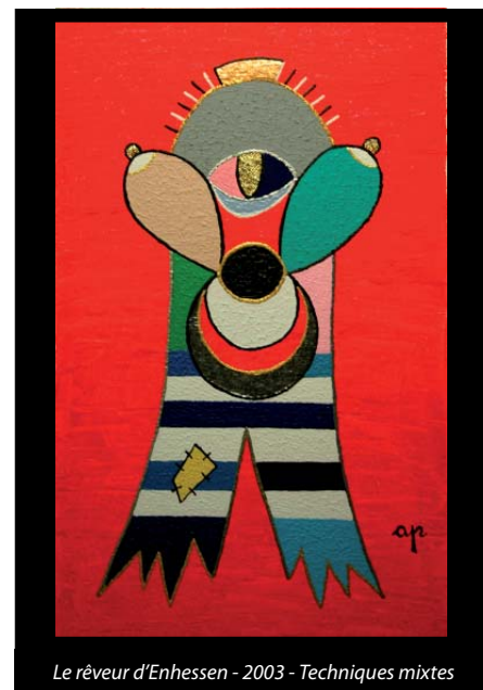
Le rêveur d'Enhessen - 2003 - Techniques mixtes